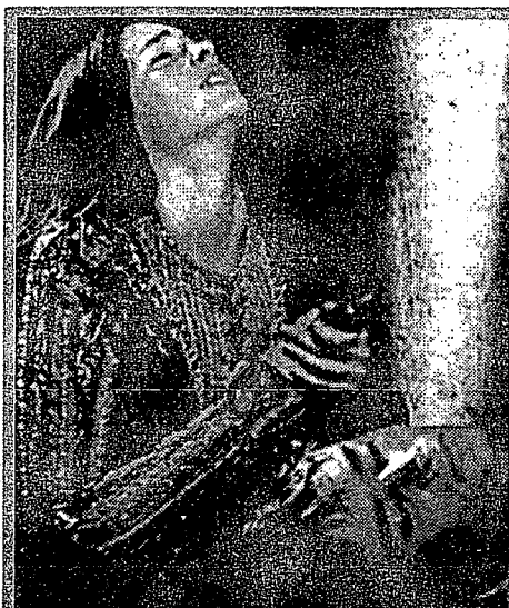
De William Shakespeare ROMEO Y JULIETA

Situación que es evidentemente muy incómoda. De hecho el problema de hallar tal ejemplo fue propuesto por Paul Painlevé a fines de siglo pasado.